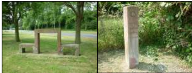
Ruhe (Offenbacher Str.)